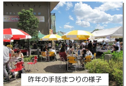
昨年の手話まつりの様子